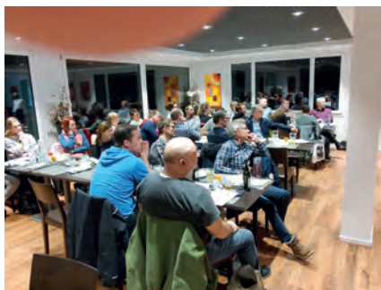
Beachtlicher Aufmarsch der Schwyzer Vereine.